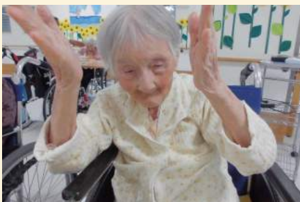
一緒に手を動かしました♪